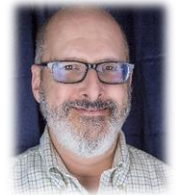
Presentado por Redmond Reams, PhD, un sicólogo licenciado

La transición de una familia de crianza a una familia adoptiva es uno de los eventos más importantes en la vida del niño. Sin embargo, frecuentemente los adultos están involucrados en las complejidades de balancear las varias necesidades de sus propios niños y el sistema de bienestar infantil. Este entrenamiento se enfocará en las estrategias para reorientar el proceso de la transición adoptiva a las necesidades de apego del niño. Muchas de estas estrategias pueden ser útiles para las transiciones entre las colocaciones de las casas de crianzas y la reunificación con los padres biológicos.